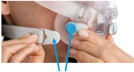
Ubicaciones de los imanes

Nota: La disponibilidad de los productos puede variar en función del país.