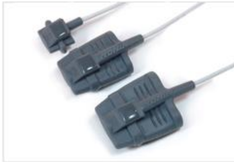
8000SS, 8000SM, 8000SL